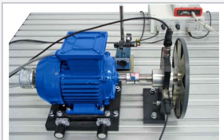
Die Abbildung zeigt PT 500.18 zusammen mit PT 500 und PT 500.04