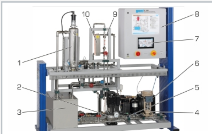
1 Rührbehälter mit Heizer, 2 Pumpe Hauptkreislauf, 3 Sammelbehälter, 4 Regelventil, 5 Aufnehmer Durchfluss, 6 Kälteaggregat, 7 Touchscreen, 8 Schaltschrank, 9 Durchflussmesser, 10 Wärmeübertrager