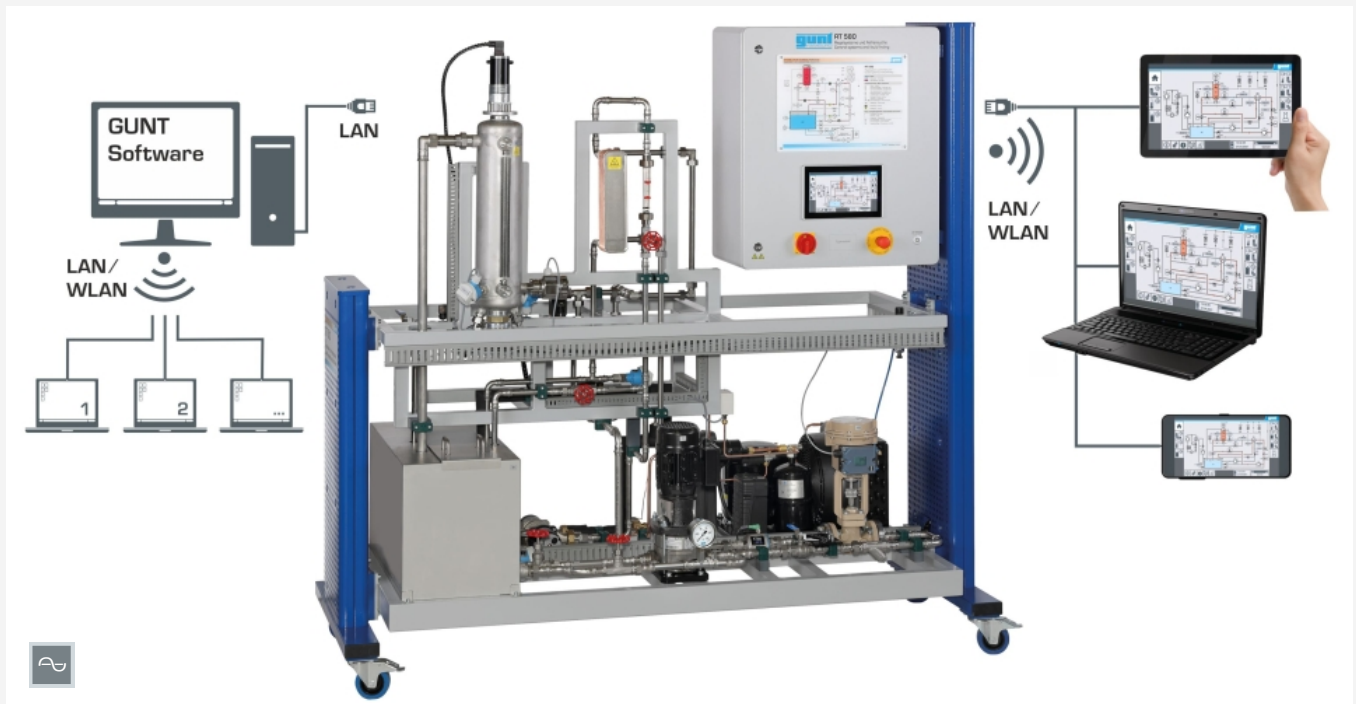
Screen-Mirroring ist an verschiedenen Endgeräten möglich