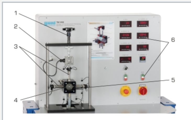
1 roue à main pour charge, 2 capteur de force pour couple de frottement, 3 capteurs de déplacement inductifs, 4 arbre, 5 logement de palier, 6 éléments d'affichage et de commande