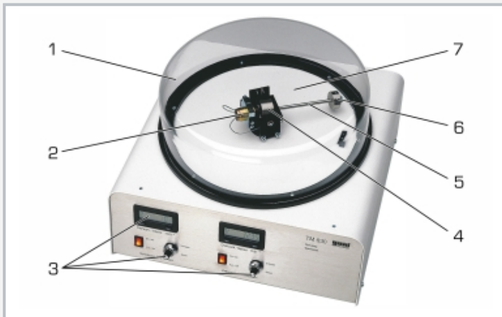
1 cubierta protectora, 2 motor de accionamiento del giroscopio, 3 indicación y ajuste del número de revoluciones para el eje horizontal del giroscopio y el eje vertical de precesión, 4 peso oscilante giroscopio, 5 palanca, 6 peso móvil, 7 bastidor interno