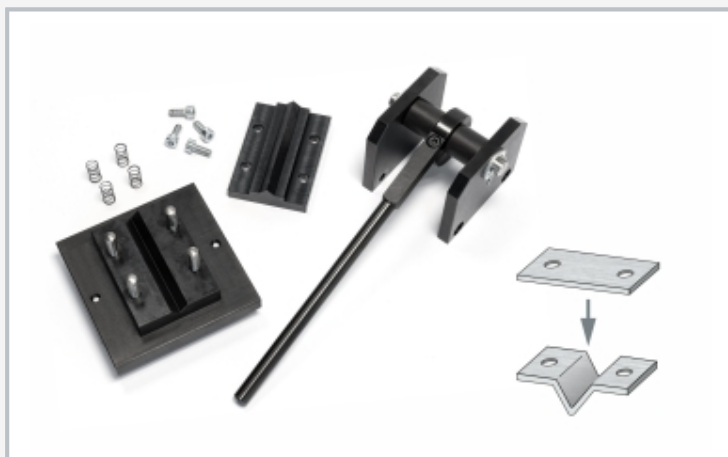
Presse de pliage décomposée en groupes fonctionnels: piston supérieur (course), châssis, levier, à droite le produit de la presse de pliage