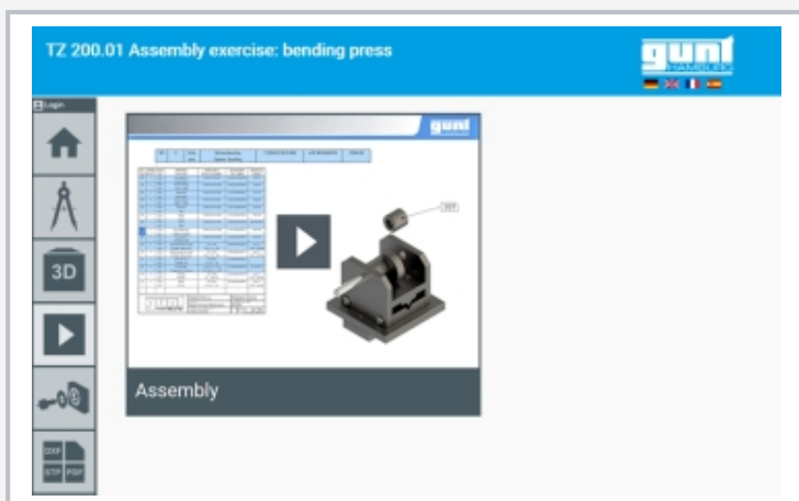
Capture d'écran du GUNT Media Center: vidéo de montage