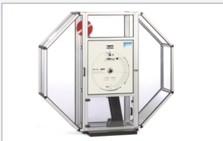
Schutzverkleidung für Pendelschlagwerk WP 410.50 als Zubehör erhältlich