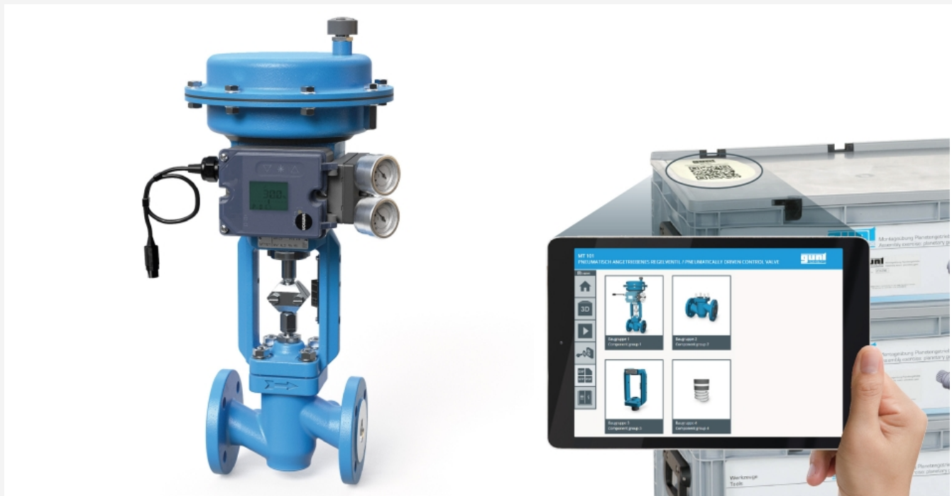
Die Abbildung zeigt das montierte Regelventil und das GUNT Media Center auf einem Tablet (nicht im Lieferumfang enthalten)