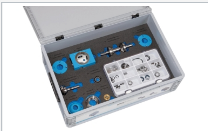
MT 121: Aufbewahrungssystem mit Schaumstoffeinlage, alle Komponenten haben ihren festen Platz, der Schaum ist beschriftet