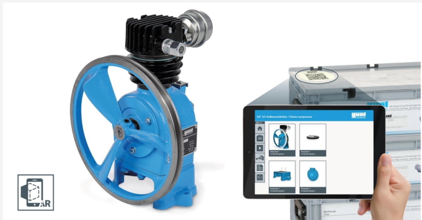
Die Abbildung zeigt den montierten Kolbenverdichter und das GUNT Media Center (Tablet nicht im Lieferumfang enthalten)