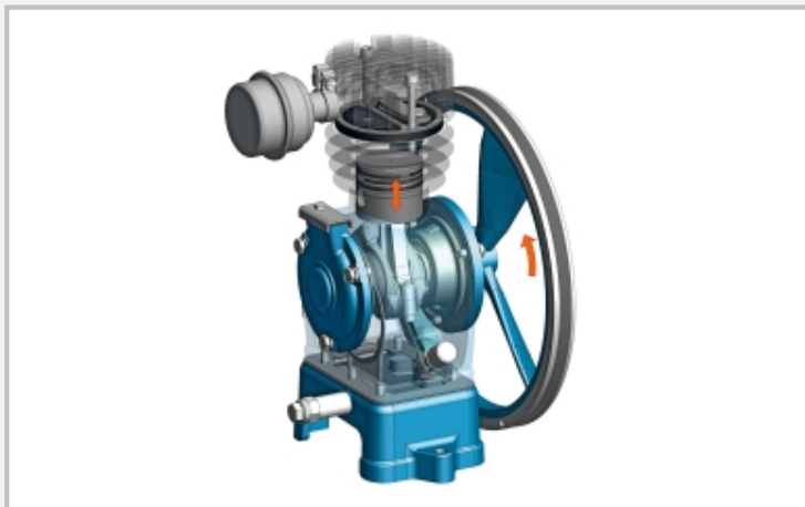
Transparente Ansicht des montierten Kolbenverdichters (Screenshot aus Montagevideo)