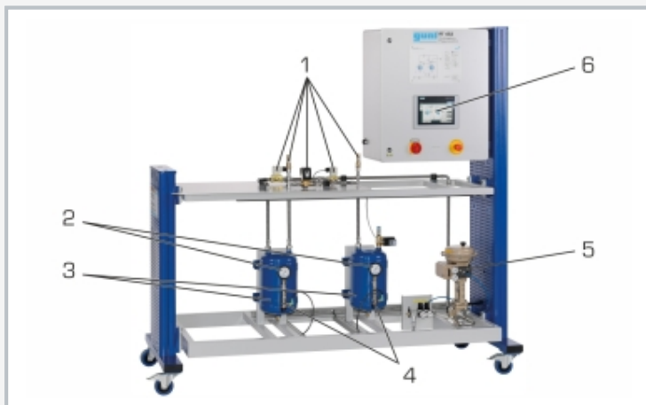
1 différentes soupapes, 2 manomètre, 3 réservoir sous pression, 4 capteur de pression intelligent, 5 vanne de régulation, 6 écran tactile