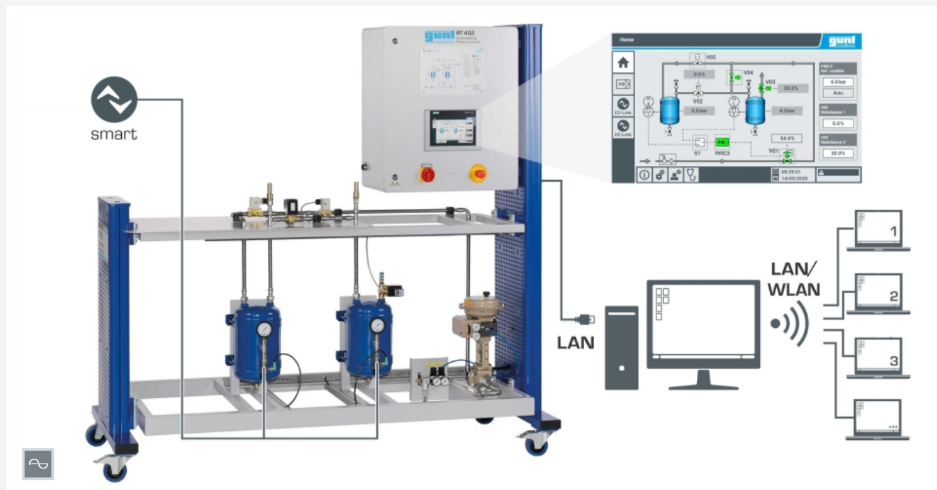
Commande et exploitation via un écran tactile ou un PC équipé du logiciel GUNT. Observation et évaluation des essais sur un nombre illimité de postes de travail via LAN/WLAN.