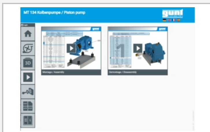
Screenshot des GUNT Media Centers