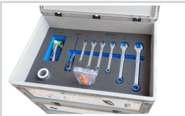
Aufbewahrungssystem mit Schaumstoffeinlage: Werkzeuge