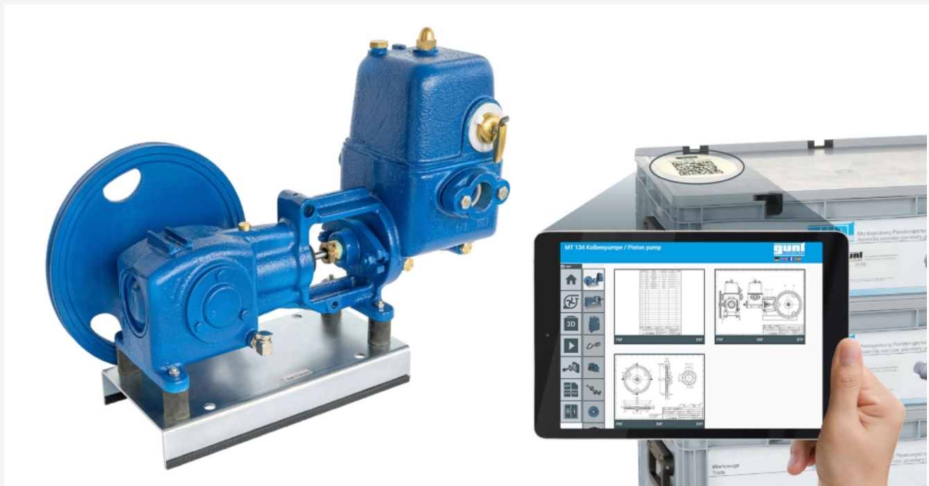
Die Abbildung zeigt das Gerät und das GUNT Media Center, Tablet nicht im Lieferumfang enthalten