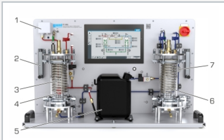
1 pressostat, 2 débitmètre, 3 condenseur, 4 soupape de détente, 5 compresseur, 6 évaporateur, 7 voyant