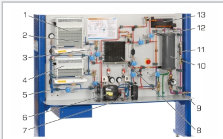
1 Verdampfer, 2 Expansionsventil, 3 Kapillarrohr, 4 Verdampfer Tiefkühlstufe, 5 Verdampfungsdruckregler, 6 Verdichter, 7 Sammler, 8 Wärmeübertrager mit Gebläse, 9 Pumpe, 10 Behälter für Glykol-Wasser-Gemisch, 11 Durchflussmesser (Glykol-Wasser), 12 Magnetventil, 13 Koaxialwendel-Wärmeübertrager