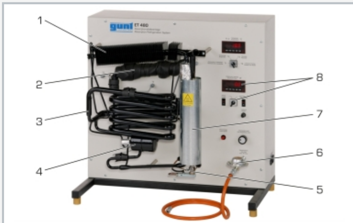
1 Verflüssiger, 2 Verdampfer mit Heizung, 3 Absorber, 4 Behälter, 5 Gasbrenner, 6 Druckminderer Propangasbetrieb, 7 Kocher mit Dampfblasenpumpe zur Austreibung von Ammoniak, 8 Anzeige- und Bedienelemente