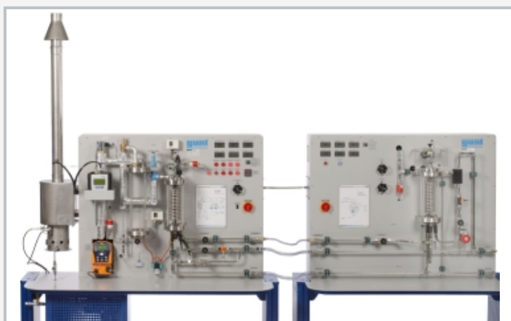
à gauche: le générateur de vapeur ET 850; à droite: la turbine axiale ET 851; en condition de fonctionnement, les deux appareils forment une centrale thermique à vapeur