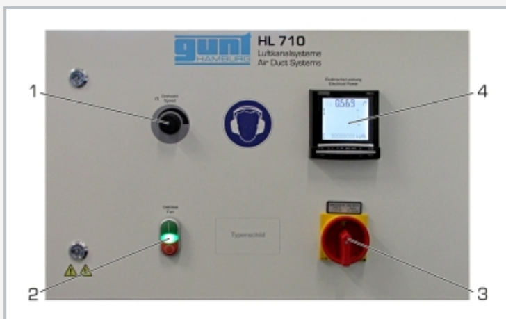
1 ajustage de la vitesse de rotation du ventilateur, 2 interrupteur MARCHE-ARRET du ventilateur, 3 interrupteur principal, 4 wattmètre