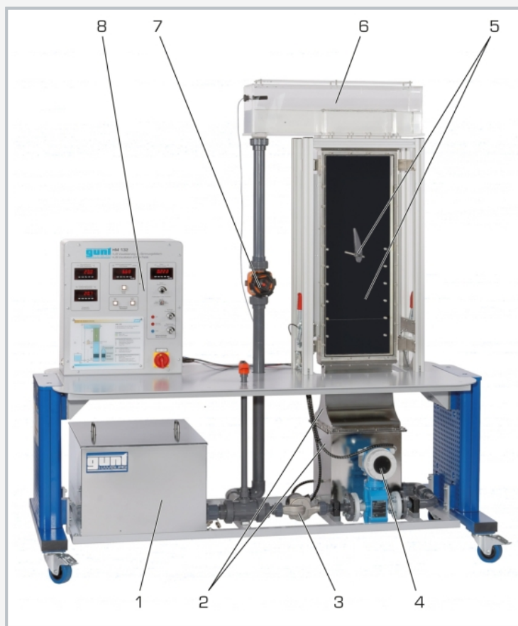
1 réservoir, 2 réservoir de stabilisation avec buse, 3 pompe, 4 débitmètre (mesure indirecte de la vitesse d'écoulement), 5 section d'essai éclairée avec modèle inséré, 6 réservoir de dégazage, 7 soupape d'ajustage de la vitesse d'écoulement, 8 armoire de commande avec éléments d'affichage et de commande