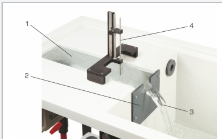
1 canal d'essai de HM 150, 2 déversoir de Rehbock, 3 lame déversante, 4 jauge à eau