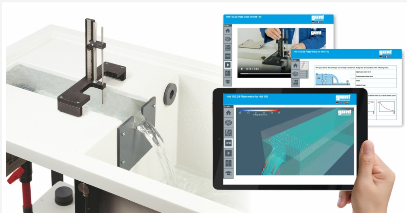
L'illustration montre le module de base HM 150 avec un déversoir de Rehbock installé et le GUNT Media Center, tablette non comprise.