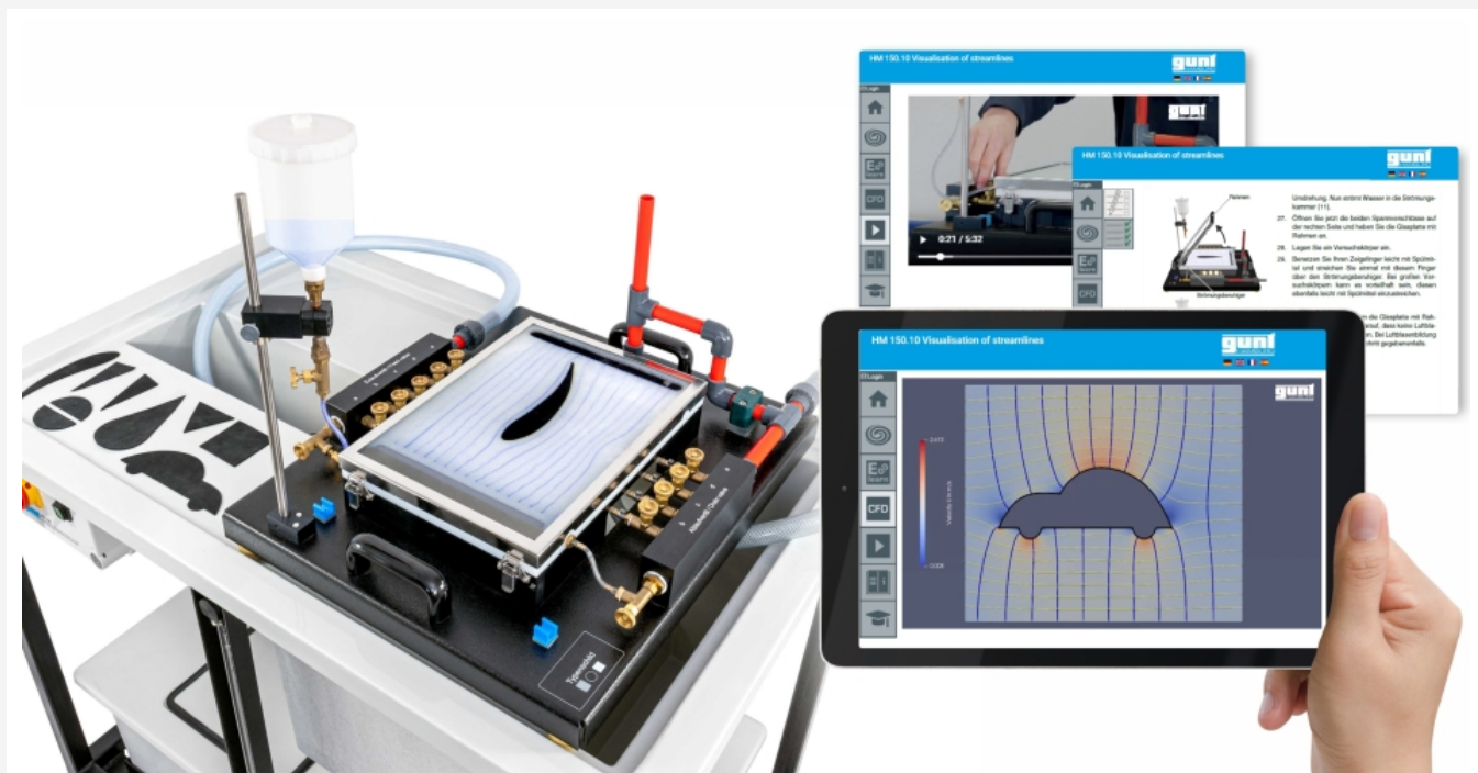
Die Abbildung zeigt das Gerät auf der Arbeitsfläche des Basismoduls HM 150 und das GUNT Media Center, Tablet nicht im Lieferumfang enthalten