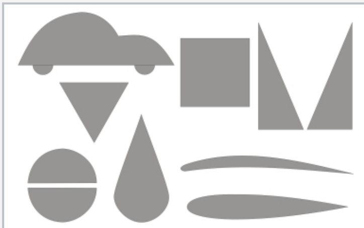
mitgelieferte Modelle Auto, Dreieck, Quadrat, 2 Dreiecke für Querschnittsänderung, 2 Halbkreise, Tropfen, Stromlinienkörper, Leitschaufelprofil