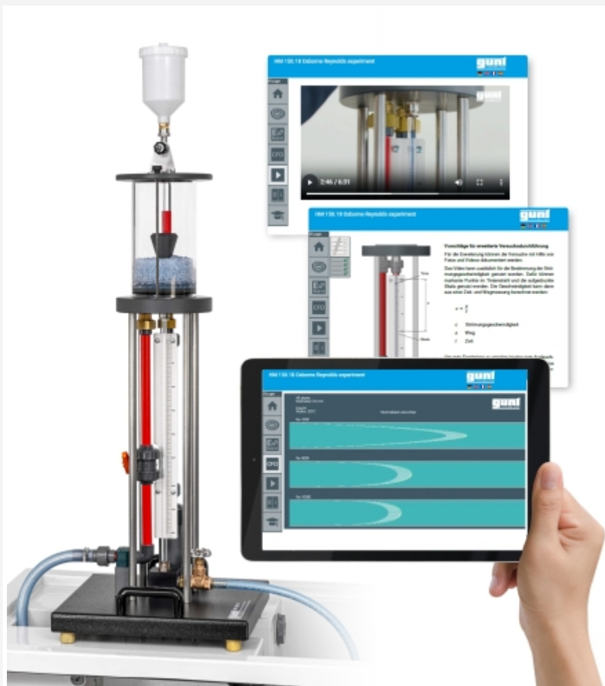
L'illustration montre le dispositif sur le plan de travail du module de base HM 150 et le GUNT Media Center, tablette non comprise