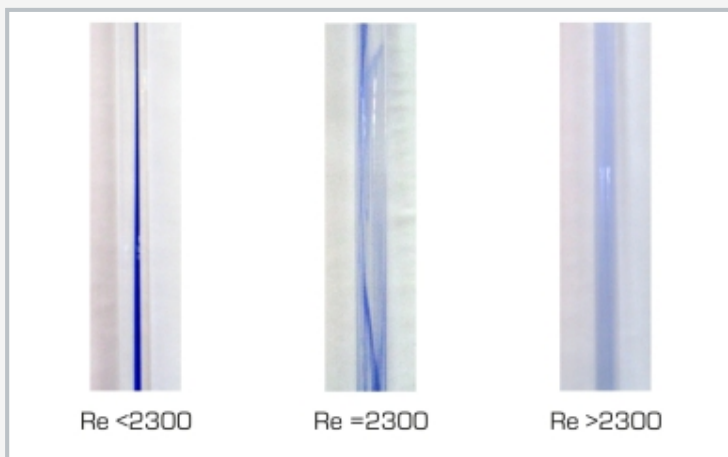
Régimes d'écoulement de gauche à droite: écoulement laminaire, transition de l'écoulement laminaire à l'écoulement turbulent, écoulement turbulent