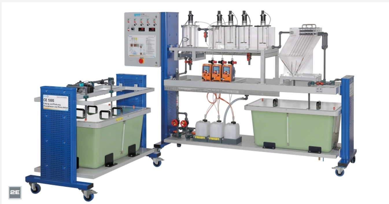
L'illustration montre: unité d'alimentation (à gauche) et banc d'essai (à droite).