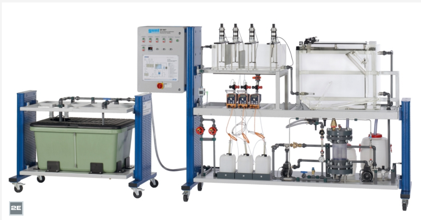
L'illustration montre: unité d'alimentation (à gauche) et banc d'essai (à droite)