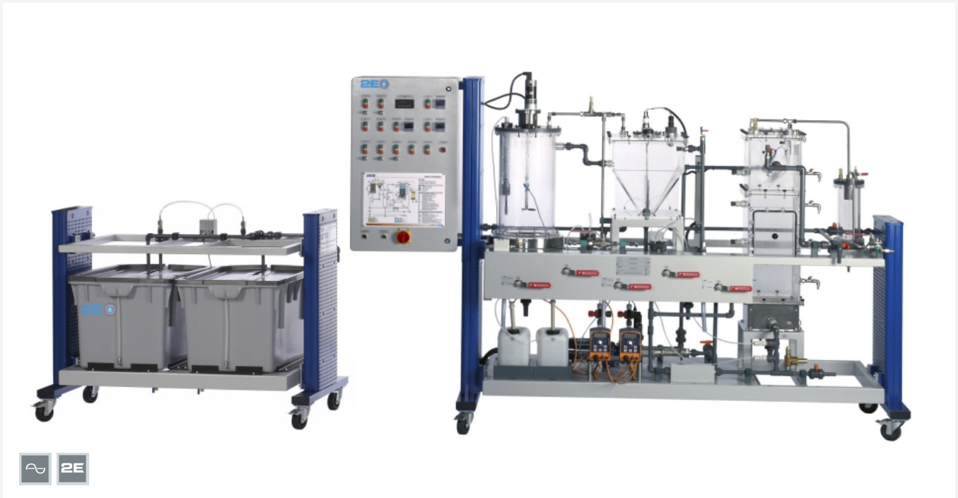
Die Abbildung zeigt: Versorgungseinheit (links) und Versuchsstand (rechts)