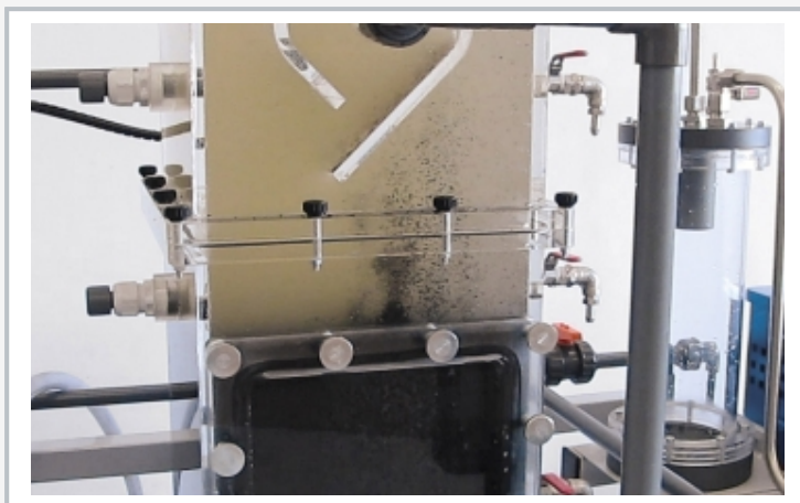
UASB-Reaktor im Versuchsbetrieb