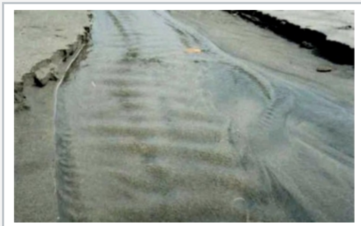
Erosion und Kolkbildung in der Natur