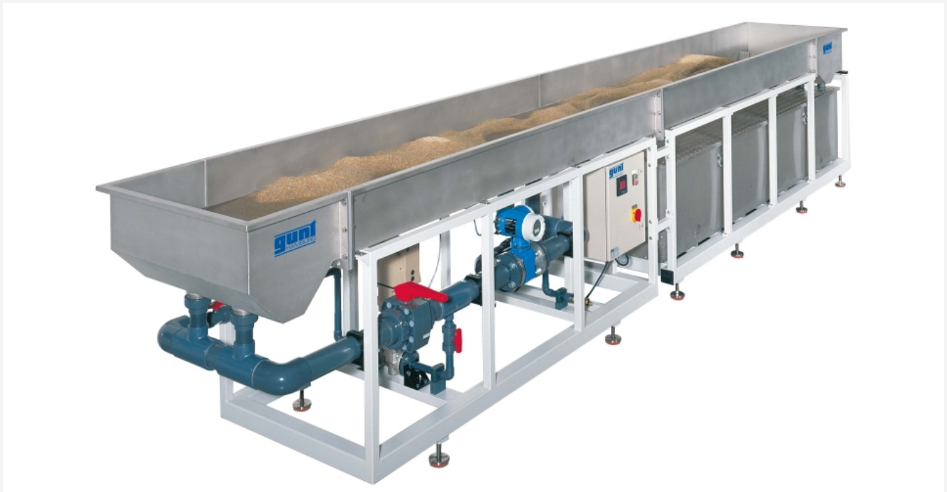
Die Abbildung zeigt ein ähnliches Gerät