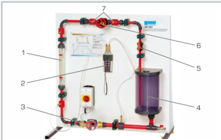
1 Durchflussmesser, 2 Druckmessgerät, 3 Pumpe, 4 Behälter, 5 Ventil zur Drosselung, 6 Membranventil, 7 Druckmesspunkte