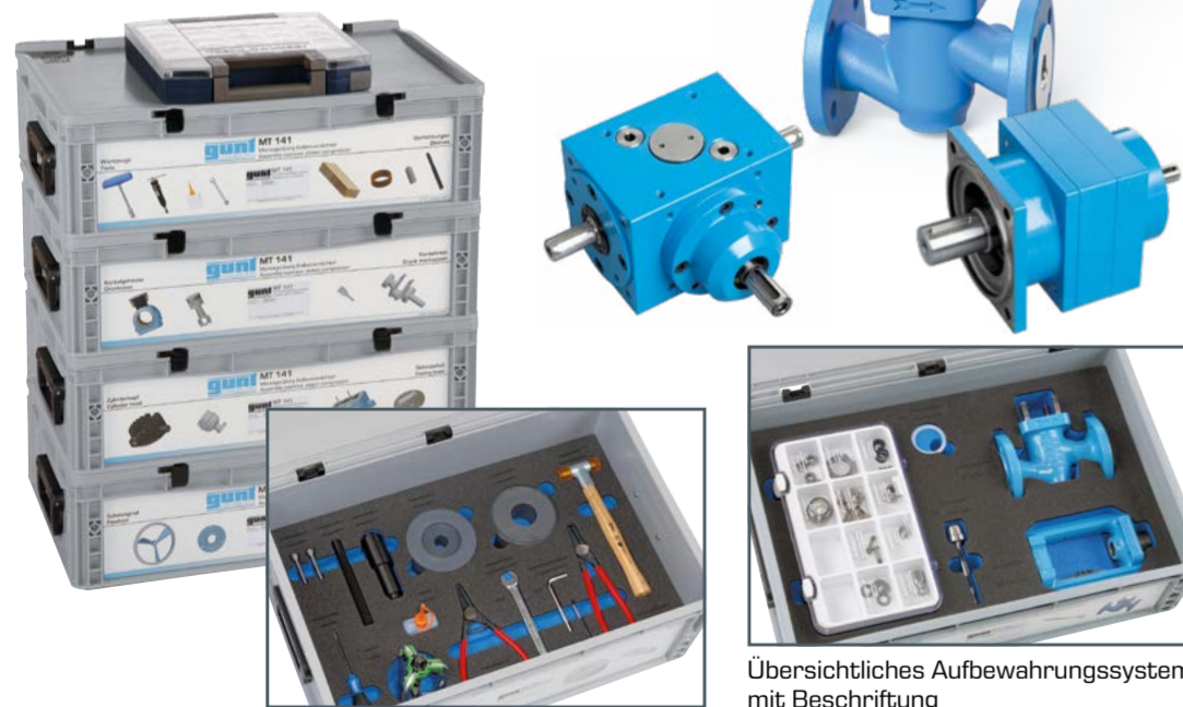
Kompletter Montagewerkzeugsatz inklusive