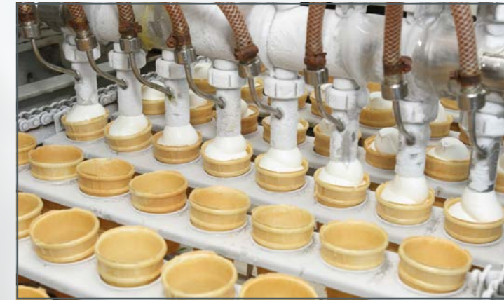
En la producción de alimentos son necesarias temperaturas fijas muy precisas para los distintos pasos de producción. Un desafío especial en la planificación de plantas de producción es la integración energéticamente eficiente de las instalaciones frigoríficas necesarias en el suministro restante de edificios.

Además de la aplicación de conceptos eficientes en las instalaciones y el uso de componentes optimizados, el control regular de todos los parámetros de funcionamiento es decisivo para la reducción a largo plazo de la demanda de energía. Los reguladores de refrigeración conectables adquieren cada vez más importancia para el control de las instalaciones, cuyos datos son registrados mediante un sistema de gestión de energía moderno para todo el edificio.