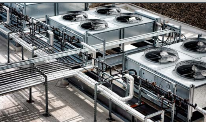
Condensador en una red de refrigerante

Las instalaciones frigoríficas constan de distintos componentes en los que se transmite energía. Todos estos componentes tienen distintos rendimientos y pueden considerarse como posibles tornillos de ajuste para una optimización. En la ingeniería de edificación, especialmente, es posible aumentar la eficiencia y rentabilidad de todo el sistema, p. ej., mediante el uso del calor residual de una instalación frigorífica para calentar edificios. Otro concepto interesante para el funcionamiento conectado en red de fuentes de calor y sumideros de calor es, p. ej., el uso de calor residual para generar frío en las instalaciones frigoríficas de absorción.