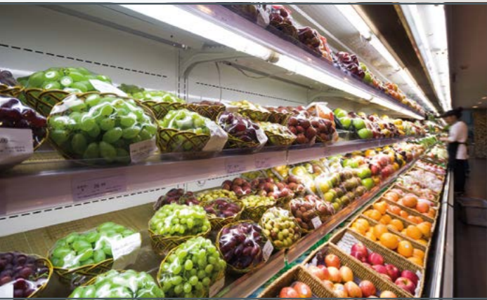
Aplicación típica para instalaciones de refrigeración: los expositores del supermercado suelen utilizar refrigeración normal.